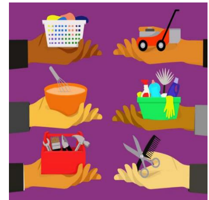
Permutas Troca de Serviços